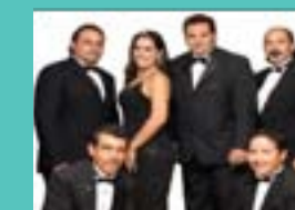
LOS TERRÍCOLAS Domingo 23