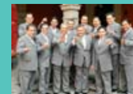
SONORA SANTANERA Domingo 16