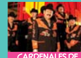
CARDENALES DE NUEVO LEÓN Lunes 24