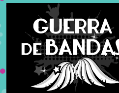
GUERRA DE BANDAS Sábado 22