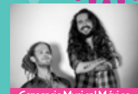
Consorcio Musical México-Alemania Daydream Nation Viernes 21