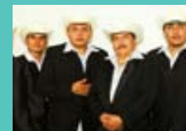
AZUL ACERO Miércoles 19