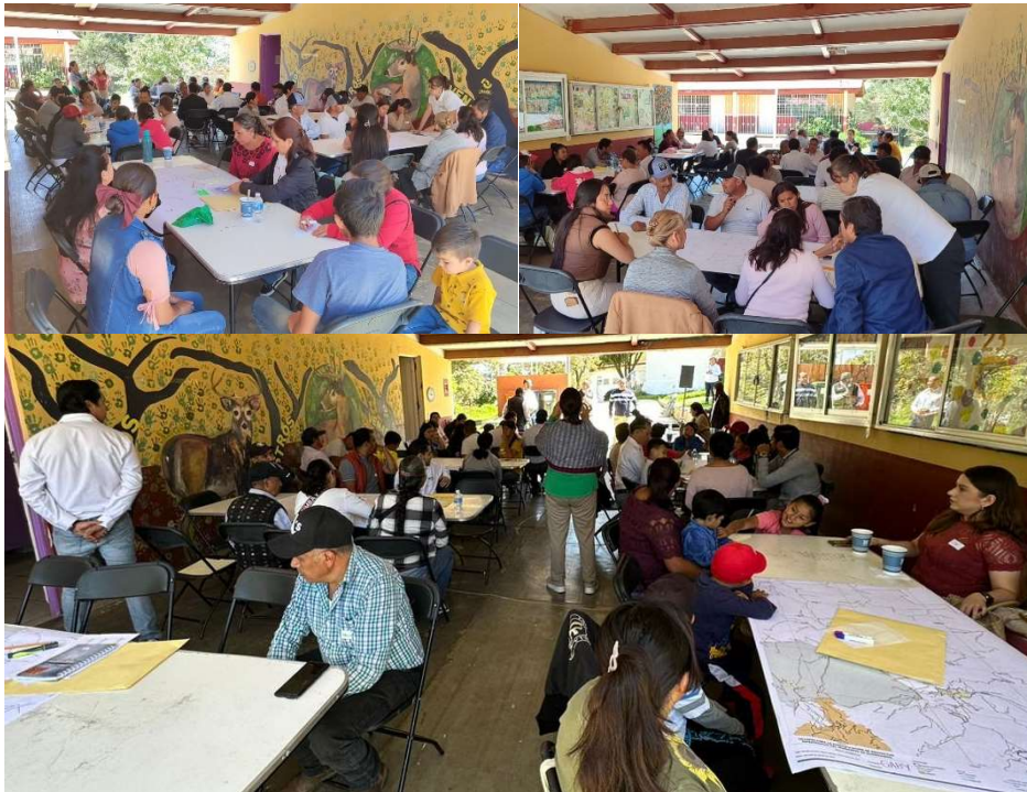
Figura 3. Evidencia fotográfica del Taller 3