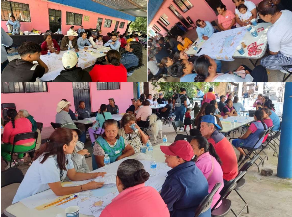
Figura 2. Evidencia fotográfica del Taller 2