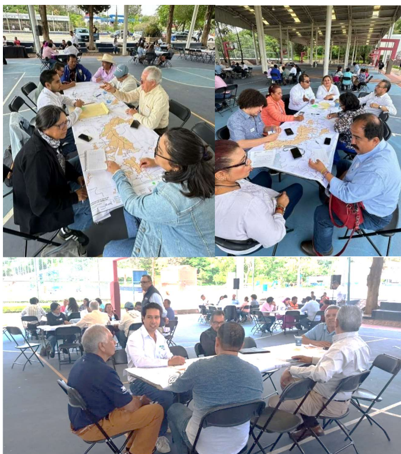
Figura 1. Evidencia fotográfica del Taller 1

En estos talleres se obtuvieron un total de 147 propuestas, las que se revisaron y conjuntaron en una matriz, revisando y priorizando las acciones de gran impacto. Estas acciones fueron integradas a la cartera de proyectos de este capítulo. A continuación, se muestran la evidencia fotográfica de los tres talleres: